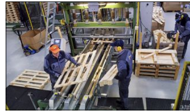
VEKST: Oppdrettsnæringa har store mål om å øke produksjonen, og den veksten vil Ytre Namdal vekst være med på.