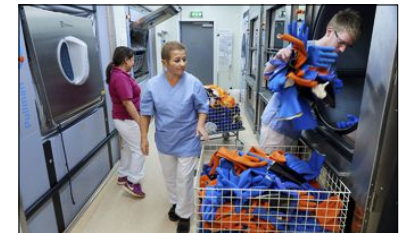
FLERE TONN: 50.000 kjledresser og ti tonn med arbeidshansker vaskes og behandles i vaskeriet per år.

gang. – Dette er blant landets tøffeste og beste vaskeri.