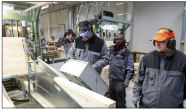
LEVERINGSDYKTIGE: Pallene til oppdrettsnæringa blir produsert lokalt, og kjøres ut når det er behov for dem.